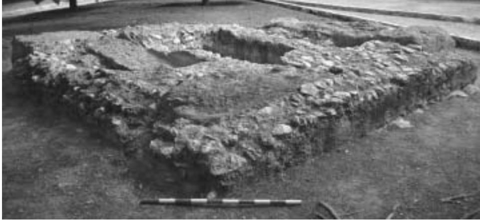
Fig. 62. Monumento funerario localizado en la calle de Rovira i Virgili (siglos I-II).

retramiento urbanístico similar al observado en el suburbio suroccidental. En este caso, sin embargo, no se aprecian indicios de recuperación de la actividad edilicia a partir del siglo V. Sólo el anfiteatro y la basílica (y área funeraria aneja) que se construye en el siglo VI en su arena permanecen activos durante la fase tardía.