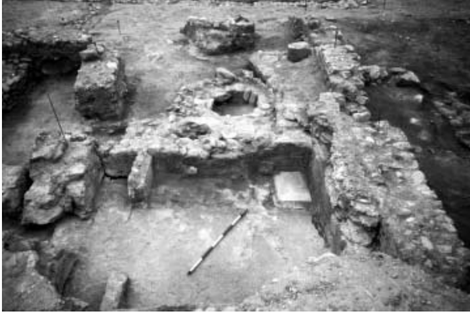
Fig. 60. Monumento funerario de cámara localizado en la avenida del Cardenal Vidal i Barraquer (siglos III-IV).

rior y con sala circular provista de hornacinas circulares y cuadradas alternantes en el interior, localizado al noreste de la Necrópolis Paleocristiana y datado en la primera mitad (HAUSCHILD 1976) o mediados del siglo IV (DEL AMO 1979) (Fig. 55, 2).