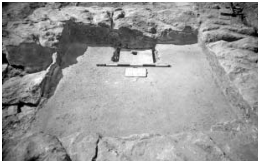
Fig. 58. Vista interior de uno de los monumentos funerarios alto-imperiales de la avenida del Cardenal Vidal i Barraquer (al fondo el receptáculo de la incineración) (siglo I).

cumentaron diversos edificios funerarios de planta cuadrangular con inhumaciones tanto debajo como encima del pavimento de época presumiblemente alto-imperial (SERRA 1929, enterramientos 504, 828-830, 659-663/706-707; SERRA 1930, enterramientos 1120-1121 y ¿1132-1135?; SERRA 1935, enterramientos 1167, 1232/1234/1237, 1328-1329, 1398-1399).