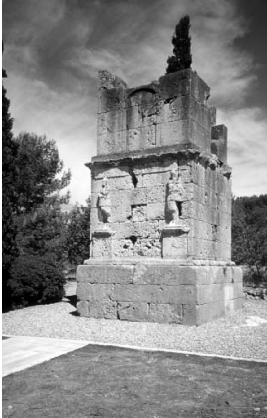
Fig. 63. Monumento funerario turriforme conocido como Torre dels Escipions (siglo I).