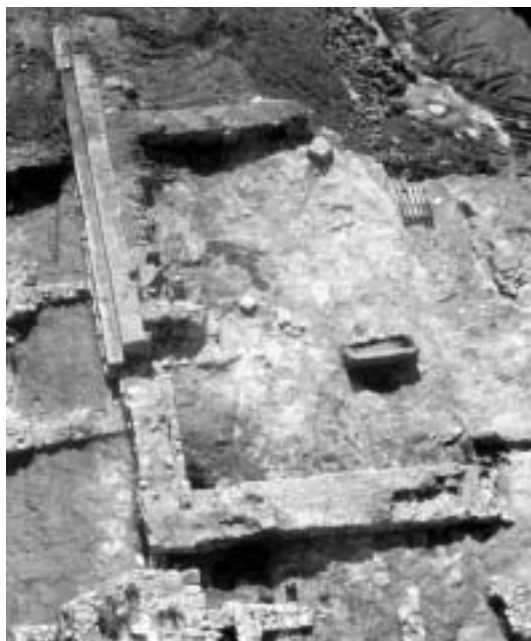
Fig. 56. Monumento funerario de las parcelas 13A-14 del PERI 2 (Jaume I-Tabacalera) (siglos I-II).

Un poco más al oeste, y al norte de la vía (actual intersección de la calle Eivissa con la avenida Vidal i Barraquer), se ha localizado la mayor concentración, hasta el momento, de evidencias funerarias in situ de los siglos I-III (Fig. 54, 6-9). De los tres monumentos identificados, el mejor conservado (¿mediados del siglo I d. C.?) presenta un ámbito interior pavimentado en opus signinum al que se accedía mediante una puerta situada en el muro oriental (Fig. 54, 8). La incinera-