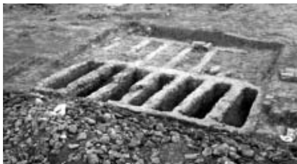
Fig. 61. Recinto funerario localizado en la avenida del Cardenal Vidal i Barraquer (siglos III-IV).

Las noticias referentes al hallazgo de evidencias funerarias tardías (posteriores al siglo III) en el suburbio nororiental son escasas, dudosas y, algunas, carentes de todo fundamento. Una ausencia de datos que puede hacerse extensible, por lo que sabemos hasta ahora, a otros indicios arqueológicos de ocupación. Existe, pues, la posibilidad de que esta área se viera, también, afectada por un proceso de