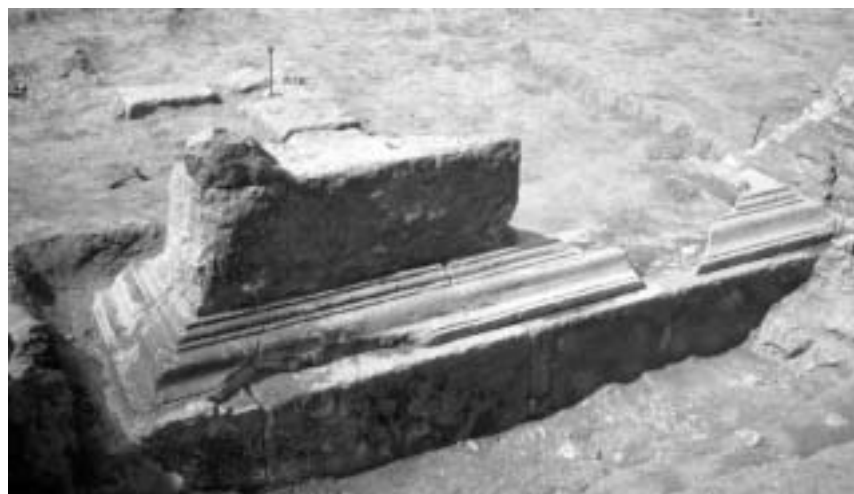
Fig. 57. Detalle de uno de los monumentos funerarios alto-imperiales de la avenida del Cardenal Vidal i Barraquer (siglo I).

Los monumentos funerarios alto-imperiales más occidentales y, por ende, más próximos al cauce del río son, hasta el momento, los hallados en las excavaciones de la fábrica de Tabacos en los años 20 y 30 del siglo XX. Uno de estos monumentos, desmontado y trasladado al área de exposición in situ del Museo de la Necrópolis Paleocristiana (en la actualidad acoge los restos mortales de su excavador, J. Serra Vilaró), estaba situado en la hipotética intersección de la vía del camí de la Fonteta con la vía secundaria N-S que seguía el cauce del río 8 (Fig. 54, 10). Se trata de un basamento de planta cuadrangular hecho de sillares sobre el que se apoya una hilada moldurada y la base del cuerpo superior (SERRA 1935, lám. III,d) 9 . Tras su traslado, se situó junto a un monumento funerario in situ (SERRA 1935, enterramiento 1236) del que se conserva la cimentación de planta cuadrangular hecha con piedras y cantos de río ligados con mortero que presenta una oquedad central en la que se documentaron cenizas y diversos ungüentarios de vidrio (Fig. 54, 12). También en estas mismas excavaciones se do-