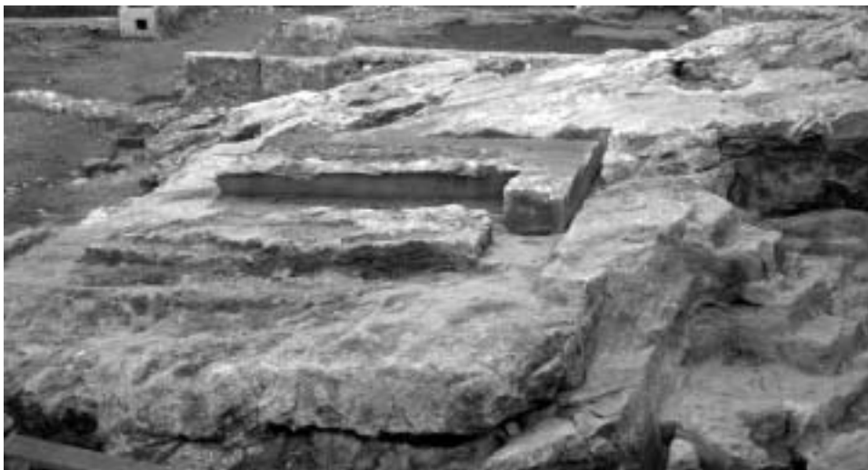
Fig. 59. Monumento funerario de la parcela 21 del PERI 2 (Jaume I-Tabacalera), sobre un sector reservado de la cantera (siglos I-II).

Los datos actuales parecen indicar que a partir de finales del siglo III y a lo largo de gran parte del siglo IV, la topografía funeraria de la ciudad experimenta transformaciones significativas estrechamente relacionadas con la recesión urbanística que experimenta durante este periodo el suburbio suroccidental. El registro arqueológico asociado a este período está formado por niveles de derrumbe, incendio y abandono del entramado suburbano, puntualmente afectados por fosas funerarias y trincheras de expolio. Unos enterramientos que, generalmente, se agrupan en pequeñas concentraciones (entre una decena y medio centenar) próximas a ejes viarios ( Fig. 55, 1-16 ).